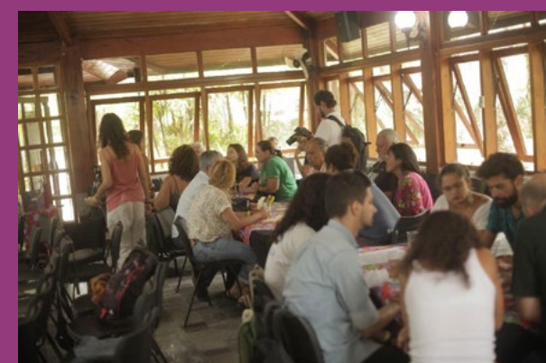
Figura 10 – Salão preparado com três mesas de Café Compartilha em atividade do FunBEA em 2020. É possível perceber duas pessoas mediando as mesas e um fotógrafo registrando os momentos.