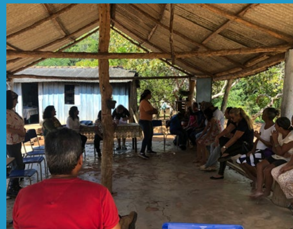
Figura 3 - Roda de diálogo realizada para construção do Projeto Político Pedagógico da APA Cabeceiras do Rio Cuiabá. Maio de 2022. Realizado pelo FunBEA.

A aplicação da Roda de Diálogo com Linha do Tempo sobre os temas REDD+ no âmbito global, no Brasil e em Mato Grosso, envolve a organização do espaço físico, com as pessoas dispostas em círculo, de modo que