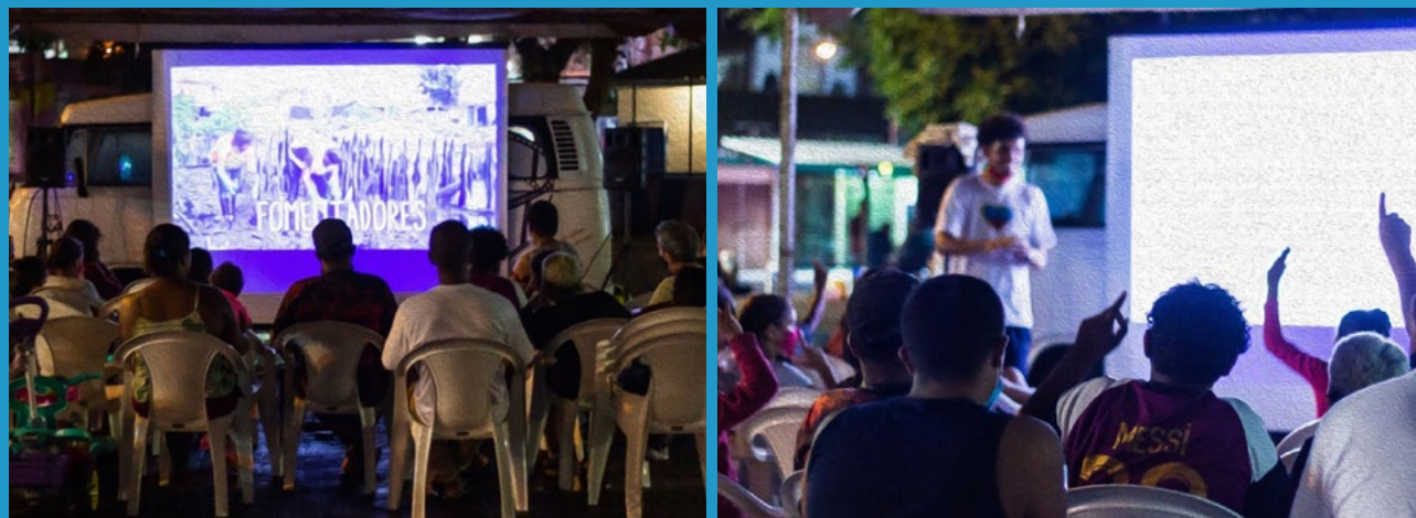
Figuras 1 e 2: Fotos do Projeto Água é Vida - FunBEA - Baixada Santista - SP - 21/22 - Sessões de Cine Debate em 9 cidades da BS. Nas fotos, uma das sessões ao ar livre.

o desmatamento através de alternativas inovadoras, como o Programa REM MT e as Salvaguardas de REDD+. Em um Cine Debate, mediador e participantes trabalham juntos, usando ideias uns dos outros e exercitando diferentes capacidades. Além de colaborar para construir conhecimento coletivo sobre um determinado conteúdo, os participantes também podem desenvolver competências, como o pensamento crítico e a habilidade de se comunicar.