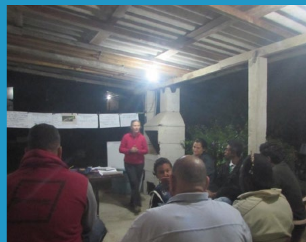
Figura 4 - Roda de diálogo, com linha do tempo em varal para qualificar a comunidade para participar da Oficina de Programas de Gestão do Plano de Manejo do Parque Estadual Restinga de Bertioga (PERB). Vila da Mata- Bertioga -SP- 21 de maio de 2018- Acervo Coletivo Educador de Bertioga.

possam conversar vendo umas às outras de frente, e também a organização de um varal, com pequenos banners, mostrando uma linha do tempo com datas e ideias importantes para impulsionar o diálogo.