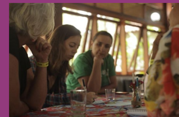
Figura 8 – Mesa arrumada para um Café Compartilha – impressões, canetas, vasilha com flor e folhas para registro de ideias. Atividade realizada pelo FunBEA em 2020 junto ao Comitê de Bacias Hidrográficas da Baixada Santista-SP.

7) Colheita: Após o encerramento das rodadas dos pequenos grupos, os participantes e anfitriões são convidados pelo mediador a retornar ao espaço principal do encontro, formando uma roda. Nesse momento, será hora de cada anfitrião compartilhar os principais pontos de diálogo da salvaguarda que estava sob sua responsabilidade. Recomendamos que sejam oferecidos a cada anfitrião em torno de 05 minutos de repasse. Durante a colheita, para além do mediador e do anfitrião, cada participante do encontro também pode ter a oportunidade de compartilhar percepções que tiveram enquanto estavam participando da dinâmica.